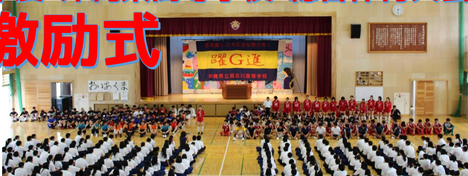
各部のキャプテンからの力強い決意表明 躍進 具志川高校