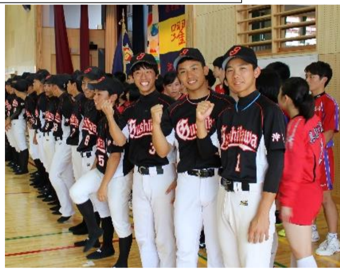
気持ちを一つに全力プレイを誓う