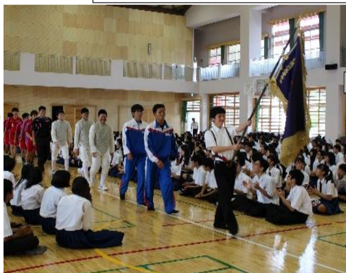
全校生徒でエールを送る！