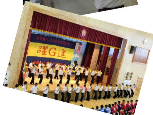
野球部による友情応援